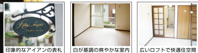
印象的なアイアンの表札 | 白が基調の爽やかな室内 | 広いロフトで快適な空間